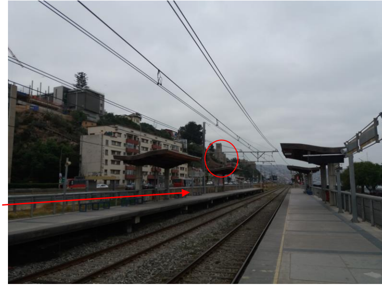
Vista desde Estación Portales del Merval