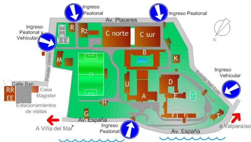
Mapa de acceso a la Universidad