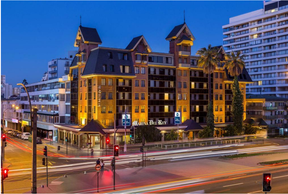
Frontis hotel BestWestern Marina del Rey

El horario de la cena es de 20h00 a 23h00.