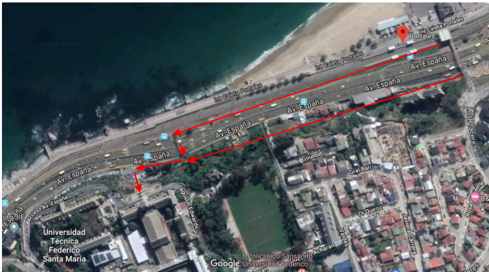
Trayecto desde Estación Portales al Centro de Eventos USM. Ubicación de paraderos de buses.